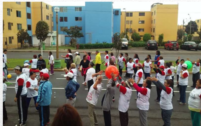
DINAMICAS RECREATIVAS Y BAILE