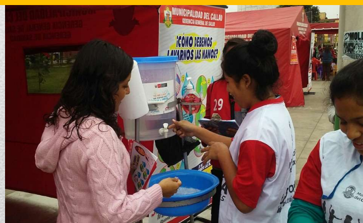
PROMOCION DE LA SALUD