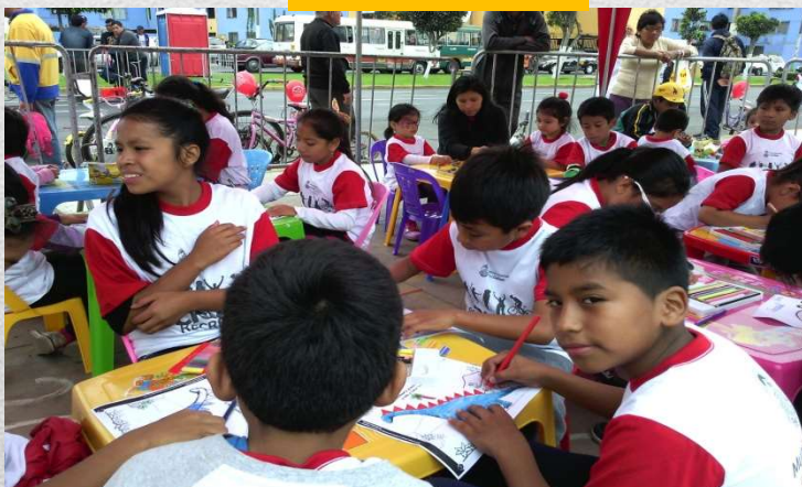
DINAMICAS PARA NIÑOS