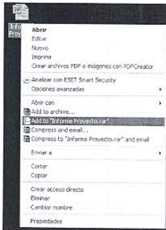
Comprimir un documento

"AÑO DE LA INTEGRACIÓN NACIONAL Y EL RECONOCIMIENTO DE NUESTRA DIVERSIDAD"