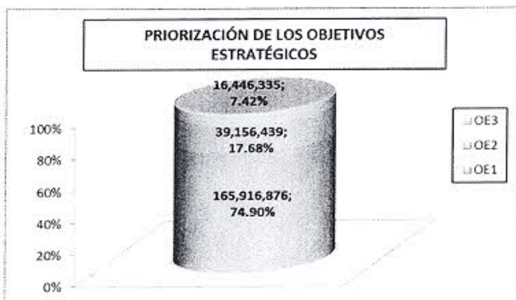
Gráfico N° 03 Distribución Presupuestal según Objetivos Estratégicos Generales para el año 2013

En el siguiente cuadro se presenta la distribución de los egresos para el año 2013, de acuerdo a la articulación de los Objetivos Estratégicos con las Metas Presupuestarias mencionados líneas arriba: