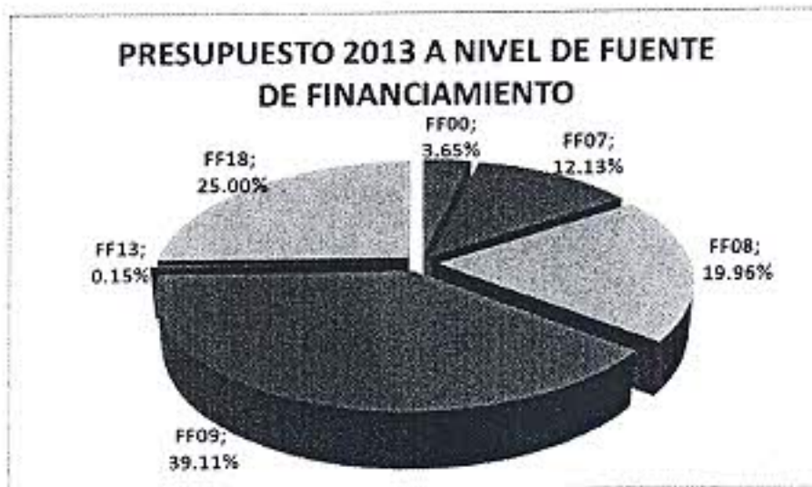
Gráfico N° 01 Distribución presupuestal por Fuente de Financiamiento para el año 2013

En el Gráfico N° 01 se muestra la distribución del presupuesto por fuentes de financiamiento, apreciándose principalmente que la mayor asignación está dada por la fuente 09 Recursos Directamente Recaudados con un 39.55%, seguidamente por la fuente 18 Canon y Sobrecanon, Regalías, Renta de Aduanas y Participaciones con el 25.28%, por la fuente 08 Impuestos Municipales con el 20.18%, por la fuente 07 FONCOMUN con el 12.27%, por la fuente 00 Recursos Ordinarios con el 2.57%, y finalmente por la fuente 13 Donaciones y Transferencias con el 0.15%.