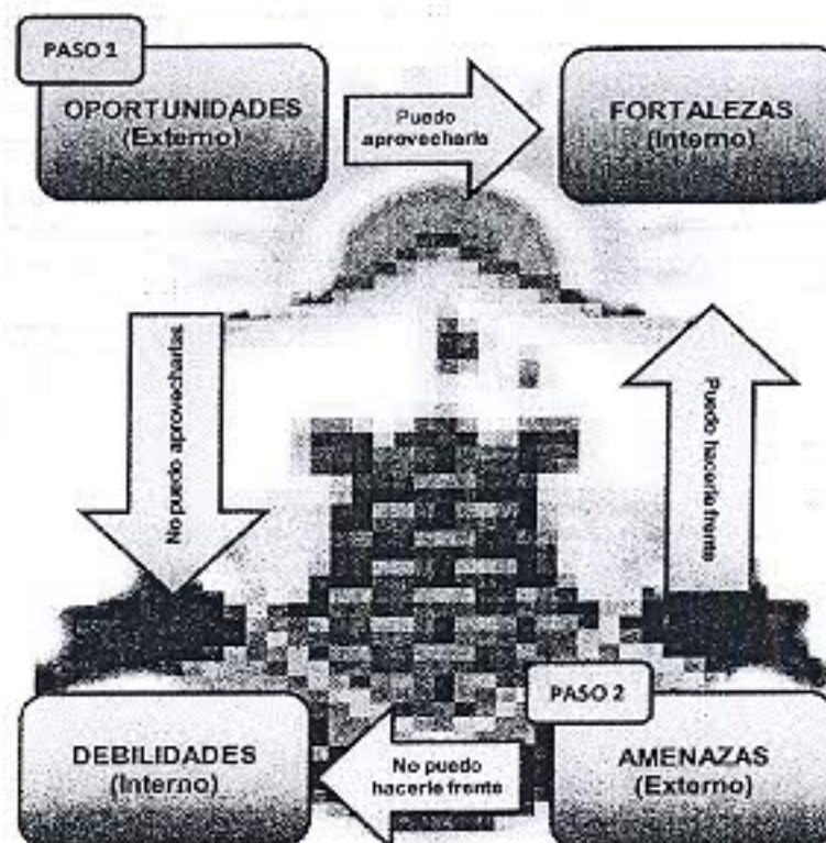
Figura N° 01 Proceso de Análisis de Macro y Micro Entorno (FODA)

En la Figura N° 01 se muestra el Proceso del Análisis FODA: