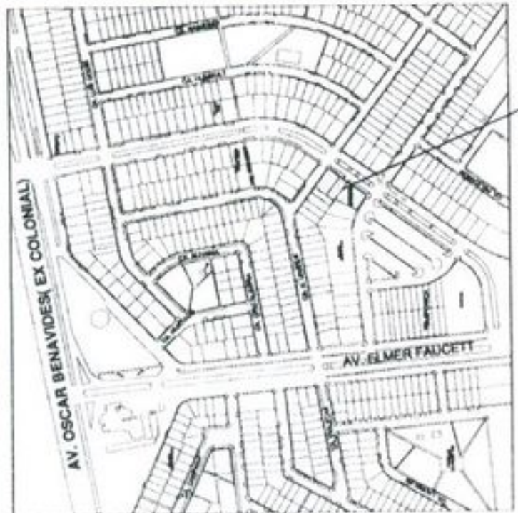
PLANO DE LOCALIZACION

DE LA ZONIFICACION APROBADA : SE APRUEBA EL CAMBIO DE ZONIFICACION DE RESIDENCIAL DE DENSIDAD MEDIA ALTA (RDMA) A COMERCIO LOCAL (CL)