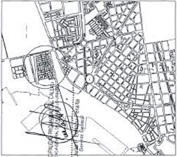
PLANO DE LOCALIZACION ESCALA 1:10,000

DE LA ZONIFICACION PROPUESTA: SE PROPONE EL CAMBIO DE ZONIFICACION DE MDM ZONA MIXTA DE DENSIDAD MEDIA A OUS USOS ESPECIALES.