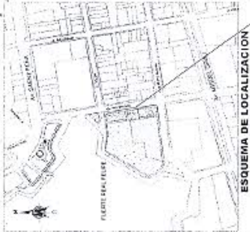
ESQUEMA DE LOCALIZACION ESCALA 1:5000