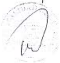
ANEXO N° 7 CARACTERISTICAS TECNICAS DEL UNIFORME PARA OPERADORES AUTORIZADOS