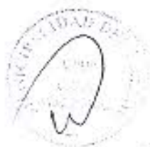
ANEXO N° 8 CARACTERISTICAS TECNICAS DEL VEHICULO DE RECOLECCION SELECTIVA DE OPERADORES AUTORIZADOS