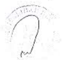
ANEXO N° 6 MAPA DE SECTORIZACION MICRO DEL SERVICIO DE RECOLECCION SELECTIVA DE RESIDUOS SÓLIDOS PARA ZONAS RESIDENCIALES